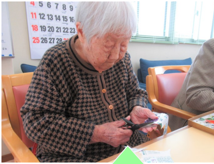
とても細かい作業ですが丁寧して下さいます(*^^*)