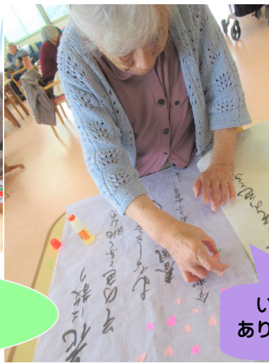
いつも素敵な作品をありがとうございます★