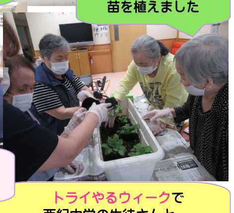
トライやるウィークで 西紀中学の生徒さんと 楽しい時間を過ごしました(*^^*)