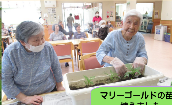
マリーゴールドの苗を 植えました