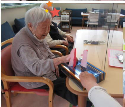
懐かしい紙相撲で 対戦しました★