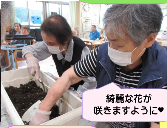
綺麗な花が 咲きますように♡